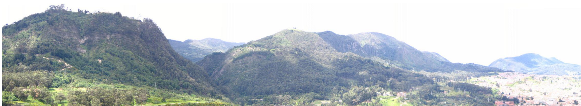
Cerros orientales de Bogotá – áreas protegidas