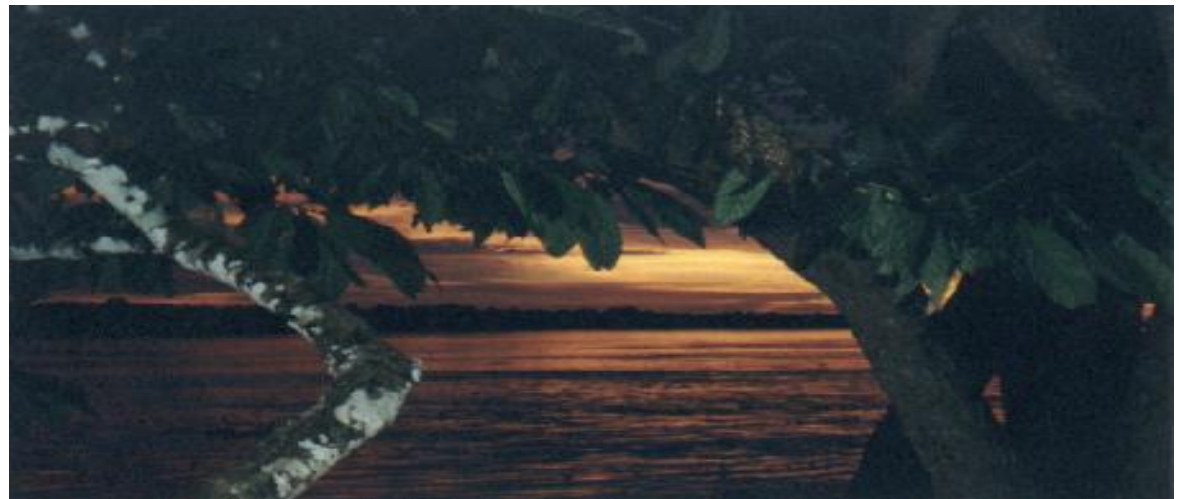
Atardecer en el Río Amazonas - Colombia

Para el mantenimiento de la vida, así como para asegurar el desarrollo de la sociedad, la ciencia y la técnica, se requiere disponer y proteger un gran número de recursos naturales.